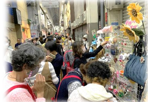
ブースにはたくさんの方が来訪されました♪

ご来場頂いた皆さま、ありがとうございました。次回は、10月13・14日です。ぜひお越し下さい。