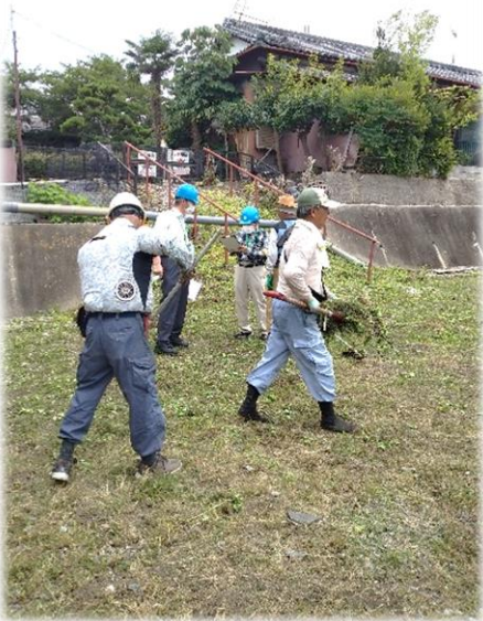
市関連施設で草刈り作業に従事する除草班 メンバー、この時期は、 空調服が手放せません（写真左）