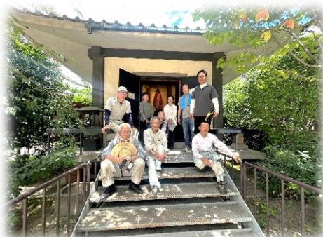
特別開扉についてのお話を お伺いしました

空調服や冷凍タオル、コールドリングなど、皆さん様々な工夫をされての作業となりました。