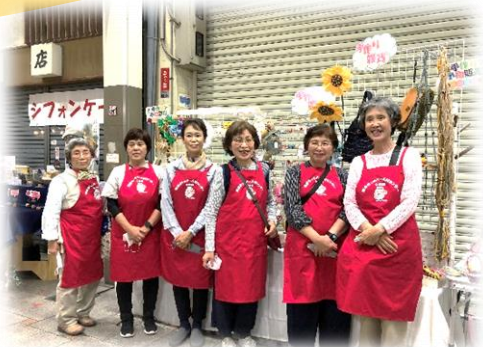
おそろいのエプロンで参加しました♪

折り紙体験コーナーでは「無限カード」作りを準備しました！前回と同じく好評で、用意した55セットすべて終了しました。体験された方は「出来た〜」「すごい！」などと楽しんでおられました。ブースの前には順番を待つ子供達の行列が出来ていましたよ(^^)♪