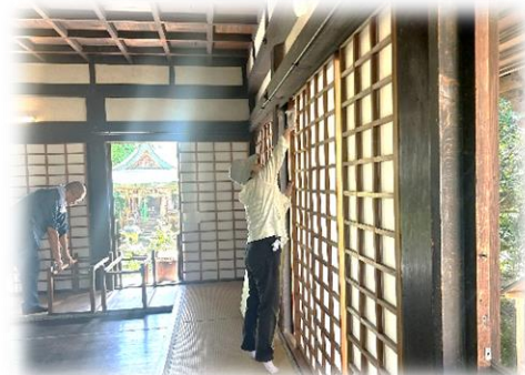
お堂の中も丁寧に拭き掃除をしました