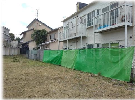
飛散防止ネットを設置（写真右）