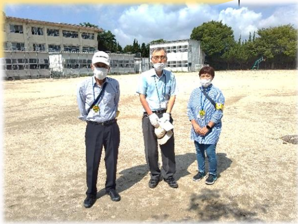
用務員として従事する福島会員（写真中） 運動場の溝掃除も大変との事です