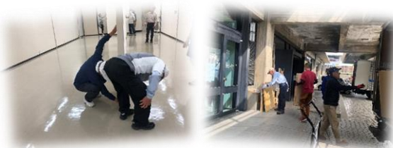
文化会館での書道展準備作業