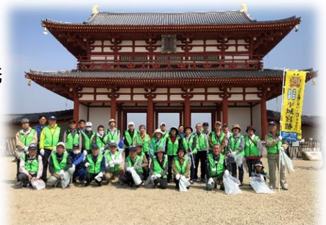
朱雀門前で集合写真を撮りました！

今後予定されているボランティア活動は、「なら燈花会」「クリーンアップならキャンペーン」「シルバーの日清掃活動」「奈良マラソン沿道サポーター」などがあります。また、地域班ごとに公園や寺社、学校などの清掃活動をされていますので参加されたい方は、就業提供案内と一緒に入っている案内文書を参考にしてください♪