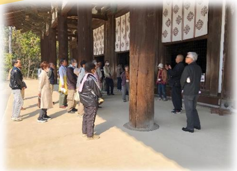
お堂の前で説法を聞きました！