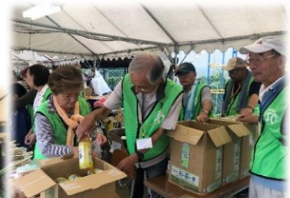
男性も女性も力を合わせて大忙し！