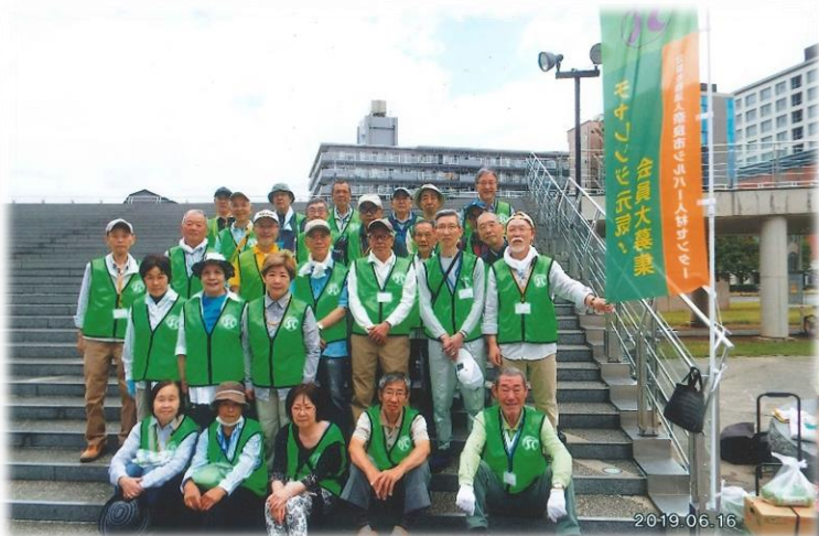
100年会館の清掃に参加されている大宮地域班の皆さん