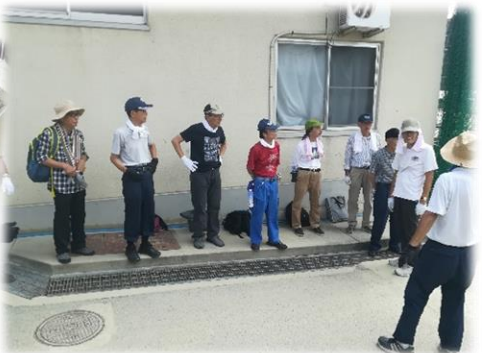
現地集合現地解散、現場で就業説明を受けます