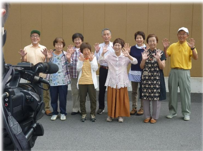
広報部・六条地域班の皆さんで、 CM最後の決めポーズを撮りました♪