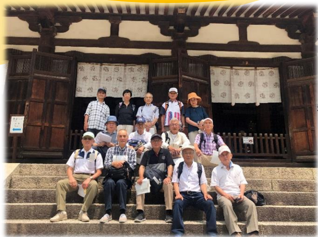
参加された富雄南・三碓地域班の皆さん