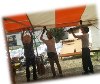
初めての顔合わせ 協力し合って作業します