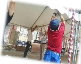
みなさん作業しやすい格好 暑さ対策も万全です