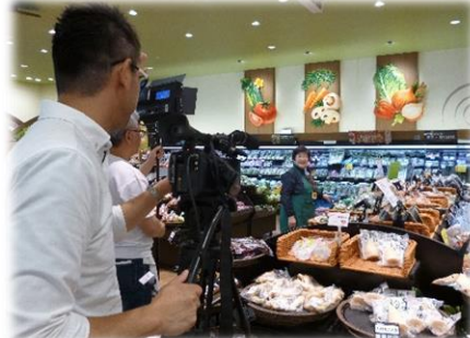
CM出演は 広報部の皆さん♪

シルバー人材センターでは、この夏奈良テレビで会員募集のCMを放映していましたが、その際の撮影現場となったのが「ならコープ七条店」！ 地元の六条地域班の皆さんにもお手伝い頂き、素敵なCMを作成することが出来ました♪