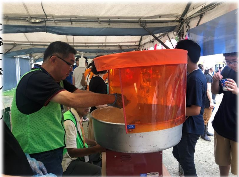
大宮班の男性陣、交代で綿菓子づくりを担当されました♪

奈良市の中心地でもある大宮地区は、たくさんの会員さんが地域班活動に参加されています。