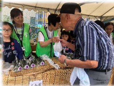
ボランティアの子供たちとおにぎりを売り出します