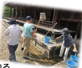
唐招提寺を清掃される 六条地域班・大安寺西地域班