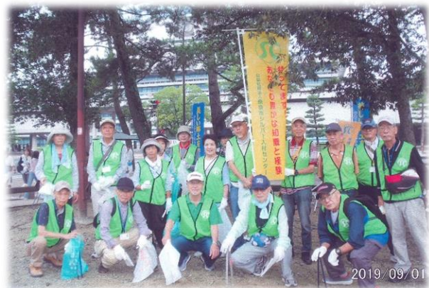
奈良公園に参加された皆さん

シルバー人材センターでは、年間を通して様々なボランティア活動しております。ご興味のある方は、事務局に一度お問い合わせ下さい♪