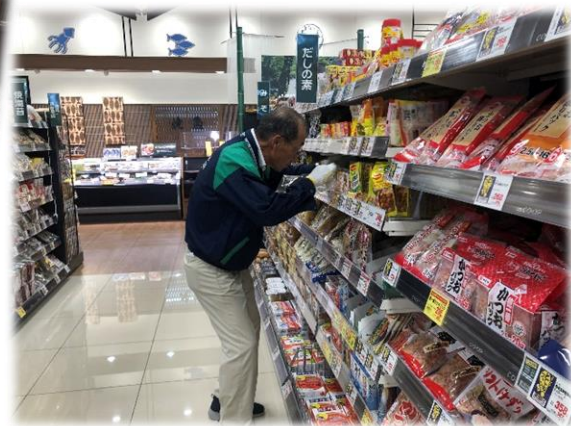
品出し担当業務では、たくさんの商品を陳列します！

ならコープ七条店では、カート回収や品出しの作業を請けており、きれいな店舗内でたくさんの会員さんが就業されています。