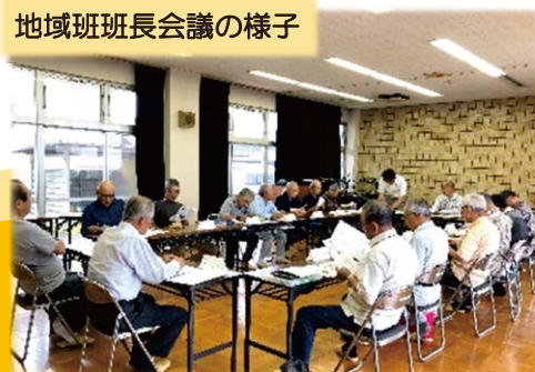
地域班班長会議の様子