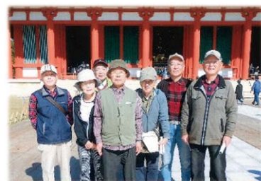
伏見南・あやめ池班のみなさん

振り返ってみると猛暑・風・雨・雪といろいろつらい時もありましたが、お客様からの「感謝」、出かける時の妻の笑顔、配分金の連絡はつらさも忘れさせます。お金はちりも積もれば山となる、で、毎年5月上京時の軍資金として、今では、自身の健康、お客様からの感謝、妻の笑顔で一石二鳥どころか三鳥・四鳥で取り巻く方々に感謝している次第です。