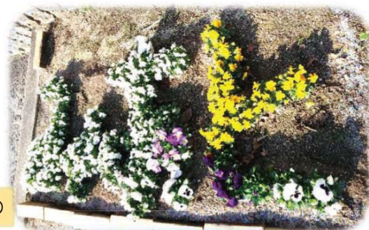
作成された花文字（読めるかな♪）