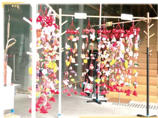
作品の「吊るし飾り」