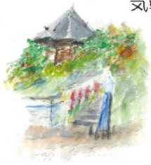
壺坂寺 ウォーキング