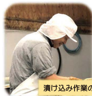
漬け込み作業の様子

また、家庭では妻と犬二頭との共同生活をしており、朝夕晩3回の散歩（1日2時間半）が健康維持に役立っています。色々な仕事の経験があり面白おかしく話をしてくれる妻はセンター入会にとっても熱心で、私も引っ張られて夫婦で入会しました。妻はまだセンターでは未就業なので、今年は妻の就業と面白い話を期待しています。これからも色々なことを実行し、有意義な楽しい人生にしていきたいと思っています。