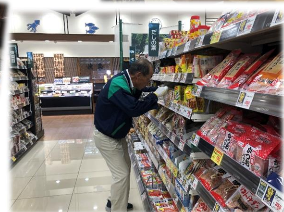
品出し担当業務では、たくさんの商品を陳列します！

スーパー業務は朝早い就業もあり、通勤距離の事を考えると地元地域の会員さんの存在がとても大切になっています。