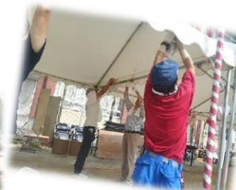
みなさん作業しやすい格好 暑さ対策も万全です