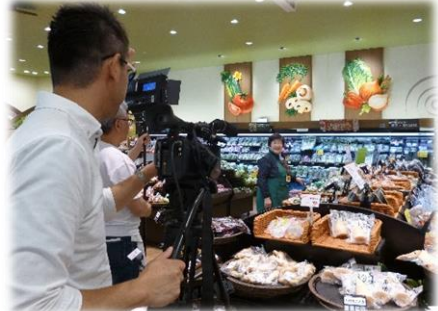
CM出演は広報部の皆さん♪

シルバー人材センターでは、この夏奈良テレビで会員募集のCMを放映していましたが、その際の撮影現場となったのが「ならコープ七条店」！ 地元の六条地域班の皆さんにもお手伝い頂き、素敵なCMを作成することが出来ました♪