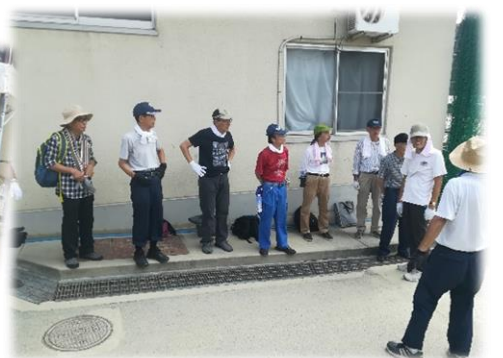
現地集合現地解散、現場で就業説明を受けます