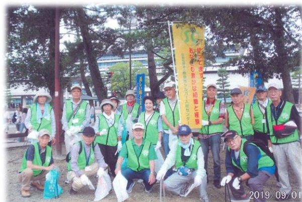
奈良公園に参加された皆さん

シルバー人材センターでは、年間を通して様々なボランティア活動しております。ご興味のある方は、事務局に一度お問い合わせ下さい♪