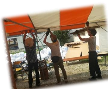
初めての顔合わせ 協力し合って作業します