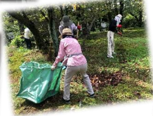
唐招提寺を清掃される六条地域班・大安寺西地域班