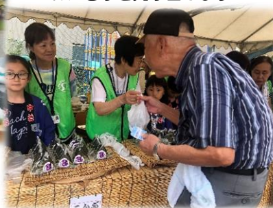
ボランティアの子供たちとおにぎりを売り出します