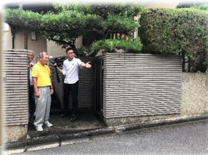
玄関先での撮影にもご協力頂きました！