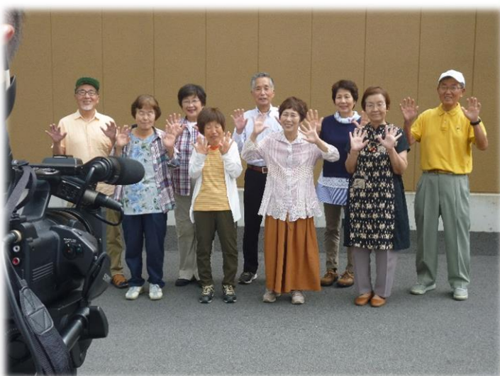
広報部・六条地域班の皆さんで、CM最後の決めポーズを撮りました♪