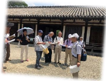
ガイドを受けながら、冗談も交えツアーを楽しみました♪