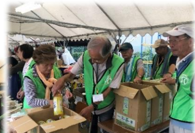
男性も女性も力を合わせて大忙し！