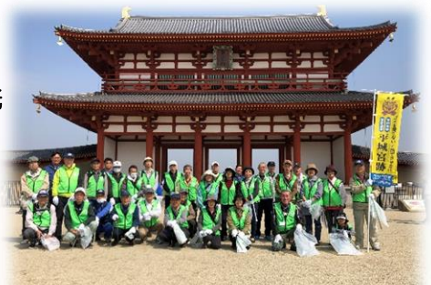
朱雀門前で集合写真を撮りました！

今後予定されているボランティア活動は、「なら燈花会」「クリーンアップならキャンペーン」「シルバーの日清掃活動」「奈良マラソン沿道サポーター」などがあります。また、地域班ごとに公園や寺社、学校などの清掃活動をされていますので参加されたい方は、就業提供案内と一緒に入っている案内文書を参考にしてください♪