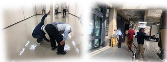
文化会館での書道展準備作業